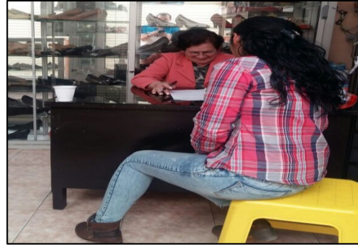
Figura 1: Encuesta aplicada a comerciantes