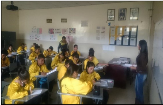
Figura 1: Encuesta aplicada a estudiantes de Bachillerato del colegio Militar Lauro Guerreo

A continuación, se ubican las imágenes de las encuestas desarrolladas a los participantes.